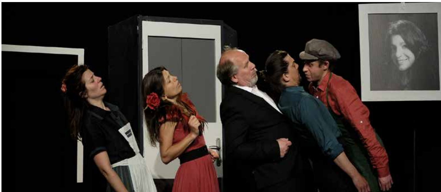
Photo répétition en construction...

Tel un vaudeville, les portes se ferment, s'ouvrent, claquent avec leurs lots de surprises. Là des fenêtres remplaceront les portes mais auront la même fonction ! Elles serviront aussi de portrait, d'effets de loupes sur les travers de nos personnages. Portrait de nantis (Comte, comtesse), de serviteurs gens du peuple (Figaro, Suzanne...). Nous utiliserons aussi tous les ressorts de la comédie, dans le jeu, la direction d'acteur, le rythme ! Les costumes seront plutôt de style intemporel...