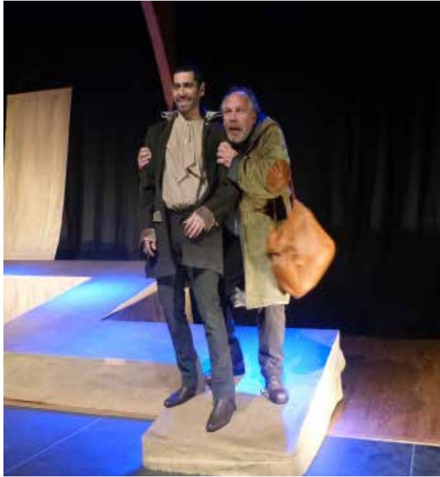
« JACQUES LE FATALISTE » DIDEROT