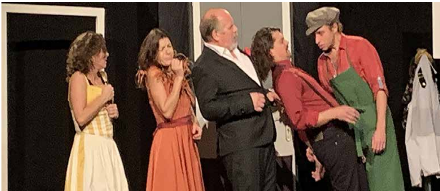
Photo répétition en construction...

Tel un vaudeville, les portes se ferment, s'ouvrent, claquent avec leurs lots de surprises. Là des fenêtres remplaceront les portes mais auront la même fonction ! Elles serviront aussi de portrait, d'effets de loupes sur les travers de nos personnages. Portrait de nantis (Comte, comtesse), de serviteurs gens du peuple (Figaro, Suzanne...). Nous utiliserons aussi tous les ressorts de la comédie, dans le jeu, la direction d'acteur, le rythme ! Les costumes seront plutôt de style intemporel...